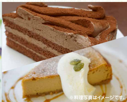
※料理写真はイメージです。